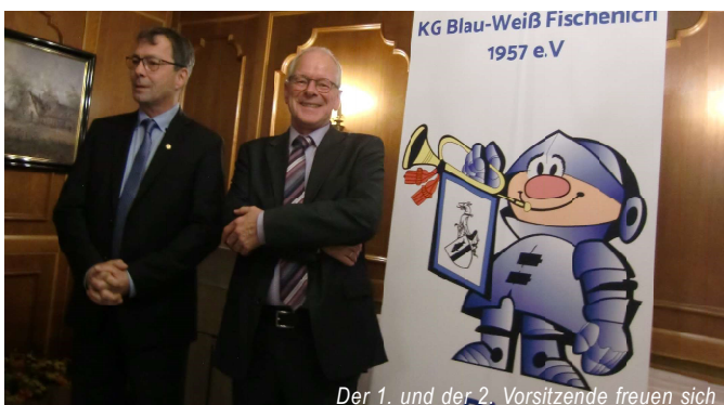
Der 1. und der 2. Vorsitzende freuen sich